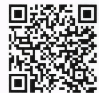
ลงทะเบียนออนไลน์