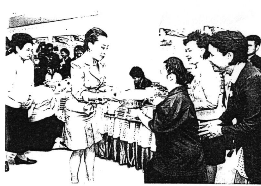
สมเด็จพระเจ้าลูกเธอ เจ้าฟ้าพัชรกิติยาภา นเรนทิราเทพยวดี เสด็จทอดพระเนตรกิจกรรม การฝึกของคนพิการทางสติปัญญา