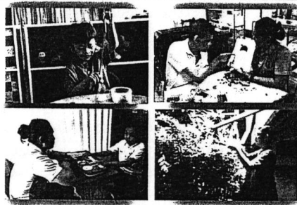
การฝึกทักษะต่างๆ