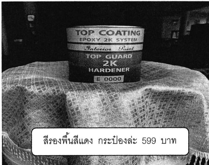
สีรองพื้นสีแดง กระจบองละ 599 บาท