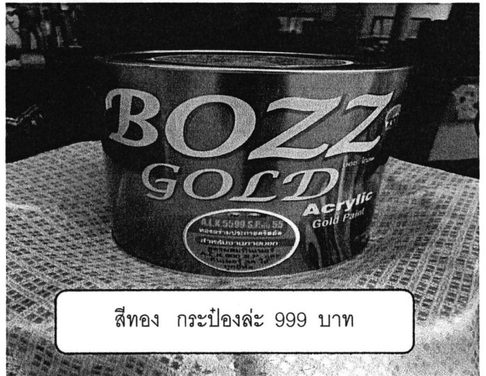
สีทอง กระจบองละ 999 บาท