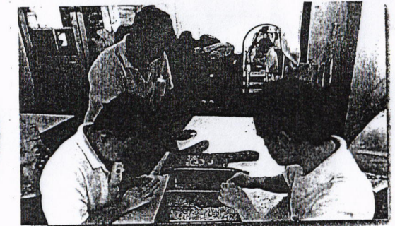
การเสริมสร้างพัฒนาการ (การใช้กล้ามเนื้อมัดเล็ก)