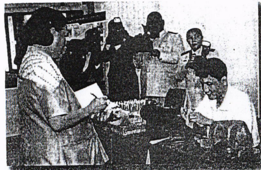
สมเด็จพระเทพรัตนราชสุดาฯ สยามบรมราชกุมารี เสด็จทอดพระเนตรกิจกรรม ด้านอาชีพคนพิการทางสติปัญญา