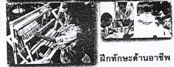
ฝึกทักษะด้านอาชีพ