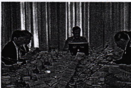
รัฐมนตรีว่าการกระทรวงสาธารณสุข เผยนายรัฐมนตรีและคณะ เห็นชอบข้อเสนอตามแผนการปฏิรูปสาธารณสุข 5 ข้อ ที่จะขับเคลื่อนให้เกิดผลในระยะเวลา 1 ปี 4 เดือน ด้วยยุทธศาสตร์ 3 เครื่องยนต์ ได้แก่ ลดความเหลื่อมล้ำ สร้างความมั่นคง ขับเคลื่อนเศรษฐกิจ สร้างความมั่งคั่ง และสร้างสมดุลในการพัฒนาให้เกิดความยั่งยืน