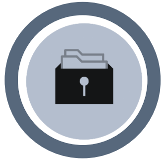
Site Master File